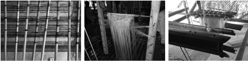
ภาพที่ 1 เทคนิคการทอซิด

ภาพที่ 1 ซ้าย การทอผ้าซิดแบบคัตไม้ซิด กลาง การทอผ้าซิดแบบตะกอซาซิด ขวา การทอผ้าซิดแบบแขวนเชือกเก็บลายซิด