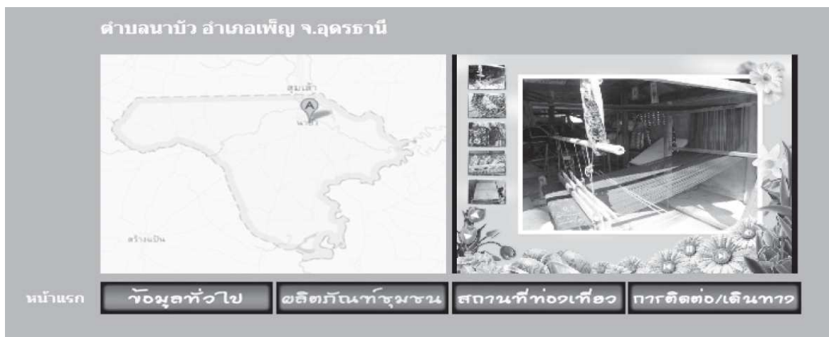
ภาพที่ 2 หน้าเว็บไซต์ตำบลนาบัว อำเภอเพ็ญ จ.อุดรธานี

การใช้งานเว็บไซต์ด้วย โดยเสียงเพลงที่เลือกใช้คือ เสียงเพลงบรรเลงด้วยเสียงดนตรีอีสานหลากหลายเพลงมาประกอบรวมกันในจังหวะดนตรีสนุกสนาน ทั้งนี้เพื่อผู้เข้าชมเว็บไซต์ได้เกิดความสุขความผ่อนคลายกับเสียงเพลงบรรเลงดังกล่าว และหากคลิกเลือกชื่อดําบลใดก็จะนำเสนอข้อมูลของดําบลนั้นในหน้าเว็บไซต์ใหม่ และจากการคลิกเลือกชื่อดําบลที่นำเสนอไว้ จากหน้าหลักของเว็บไซต์ จะนำเสนอข้อมูลของดําบลนั้นในหน้าเว็บไซต์หน้าใหม่ ดังภาพที่ 2-5