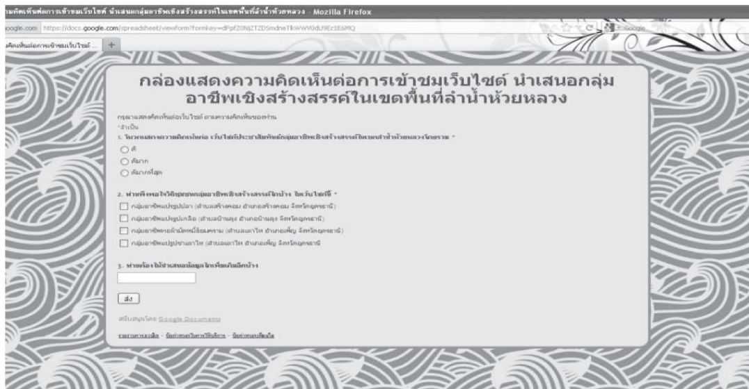
ภาพที่ 6 กล่องแสดงความคิดเห็นจากผู้เข้าชมผ่านเว็บไซต์

ข้อมูลทั่วไป ผลิตภัณฑ์ชุมชน สถานที่ท่องเที่ยว และการติดต่อและการเดินทางและได้จัดทำกล่องรับความคิดเห็นต่อการเข้าชมเว็บไซต์โดยใช้พื้นที่เก็บข้อมูลความคิดเห็นผ่าน www.google.com โดยนำเสนอไว้ที่หน้าหลักของเว็บไซต์ในส่วนด้านล่างของพื้นที่เว็บไซต์ ซึ่งสามารถนำเสนอได้ดังภาพที่ 6-7 ดังนี้