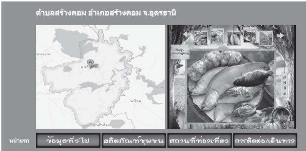
ภาพที่ 5 หน้าเว็บไซต์ตำบลสร้างคอม อำเภอสร้างคอม จังหวัดอุดรธานี

จากภาพที่ 2-5 แสดงถึงหน้าเว็บไซต์ที่แสดงข้อมูลของตำบลเสนอต่าง ๆ และมีเมนูนำเสนอข้อมูลประกอบด้วยแผนที่แสดงอาณาเขตของตำบลสร้างคอม ภาพผลิตภัณฑ์เดียวแสดงรูปภาพผลิตภัณฑ์ชุมชนของตำบลสร้างคอมคือผลิตภัณฑ์ปลาโดยจัดนำเสนอในรูปแบบภาพมัลติมีเดียแบบภาพสไลด์ และจัดนำเสนอข้อมูลในเมนูกลุ่มเรื่อง