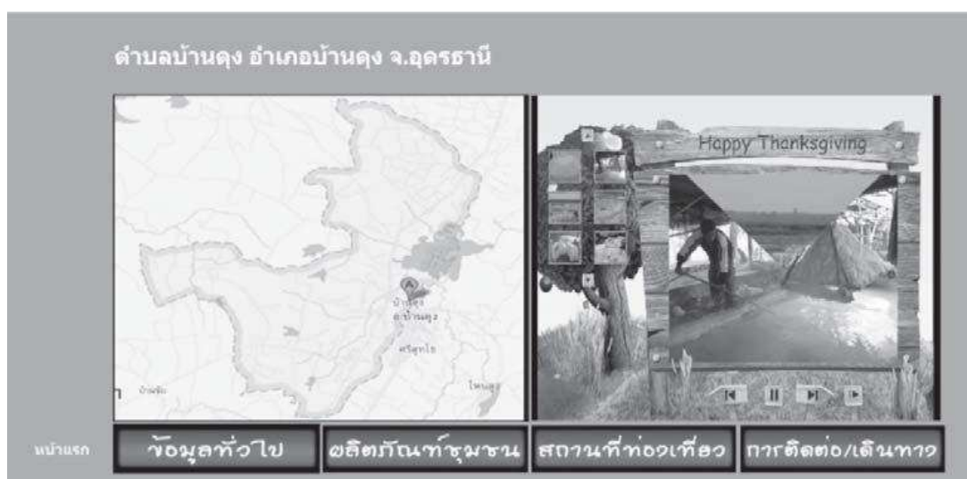
ภาพที่ 4 หน้าเว็บไซต์ตำบลบ้านดุง อำเภอบ้านดุงจังหวัดอุดรธานี

จากการคลิกเลือกชื่อตำบลบ้านดุง อำเภอบ้านดุง ข้อมูลของตำบลบ้านดุงในหน้าเว็บไซต์หน้าใหม่ดังภาพที่ 4 จังหวัดอุดรธานี จากหน้าหลักของเว็บไซต์ จะนำเสนอ