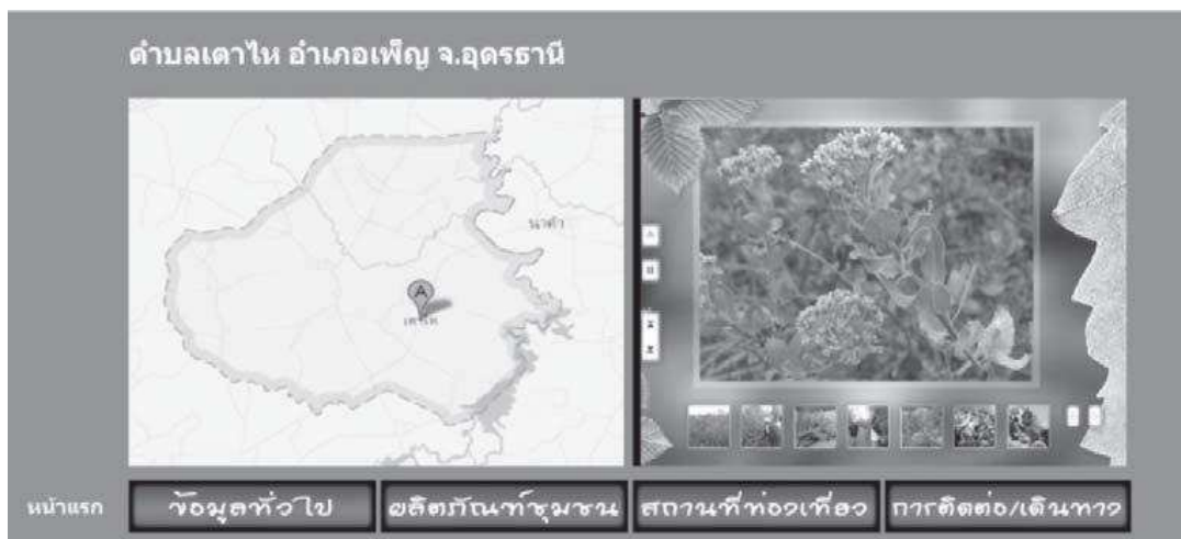
ภาพที่ 3 หน้าเว็บไซต์ตำบลเตาไห อำเภอฟะนิง จังหวัดอุดรธานี

จากการคลิกเลือกชื่อตำบลบ้านดุง อำเภอบ้านดุง ข้อมูลของตำบลบ้านดุงในหน้าเว็บไซต์หน้าใหม่ดังภาพที่ 4 จังหวัดอุดรธานี จากหน้าหลักของเว็บไซต์ จะนำเสนอ