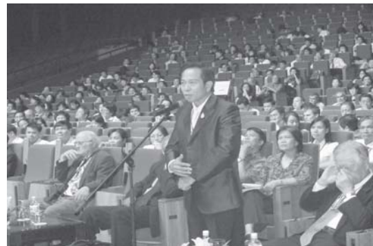
การเข้าร่วมประชุมวิชาการระดับนานาชาติ