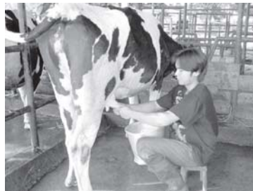
การดำเนินงานทดลองภายใต้ศูนย์วิจัยฯ

E-mail: trofrec@kku.ac.th , metha@kku.ac.th